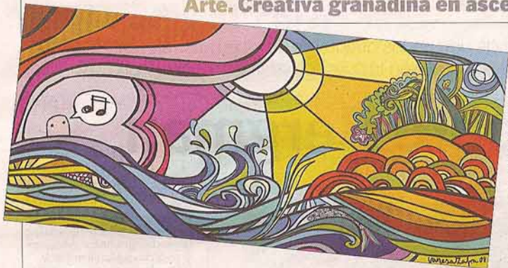
Cabecera de la web de Tertulia Andaluza (tzq.) y portada del último disco de Lori Meyers, 'Cronolánea'.